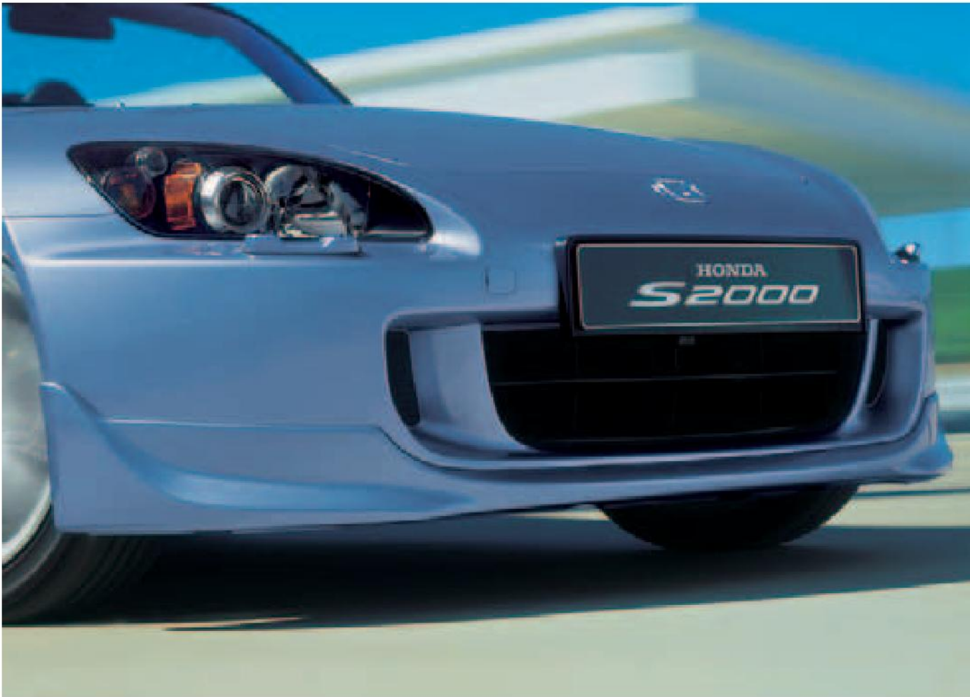
Para lograr un exterior del automóvil todavía más impactante, dispone de spoiler delantero.