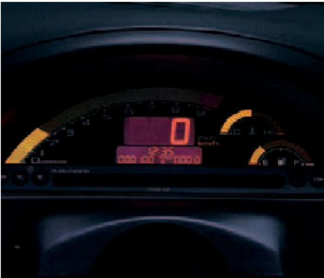
El panel de instrumentos del Honda S2000 es una pantalla digital de fácil lectura.