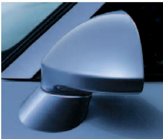
Es una experiencia conducir el Honda S2000 incluso cuando no hace sol porque los retrovisores cuentan con elementos térmicos tras el vidrio para asegurar la visibilidad trasera.