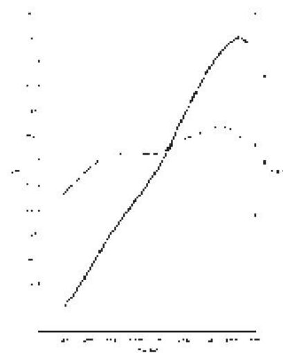
El motor de Honda DOHC VTEC combina unas buenas características del par motor a bajas revoluciones con una gran potencia a elevadas revoluciones.

El corazón del Honda S2000 se encuentra en su avanzada tecnología. Con métodos de fabricación exclusivos, Honda ha creado un motor de 2.0 litros excepcional que alcanza los 100 Km/h en 6,2 segundos. Un máximo de 8.300 rpm ofrecen 120 CV por litro, algo inimaginable fuera de los circuitos de competición. El secreto tras este alto nivel de prestaciones es un motor de cuatro cilindros compacto y ligero que incorpora el sofisticado sistema VTEC. Un proceso que regula la apertura y elevación de las válvulas, combinando unas buenas prestaciones del par motor a bajas revoluciones con una gran potencia en regímenes elevados.