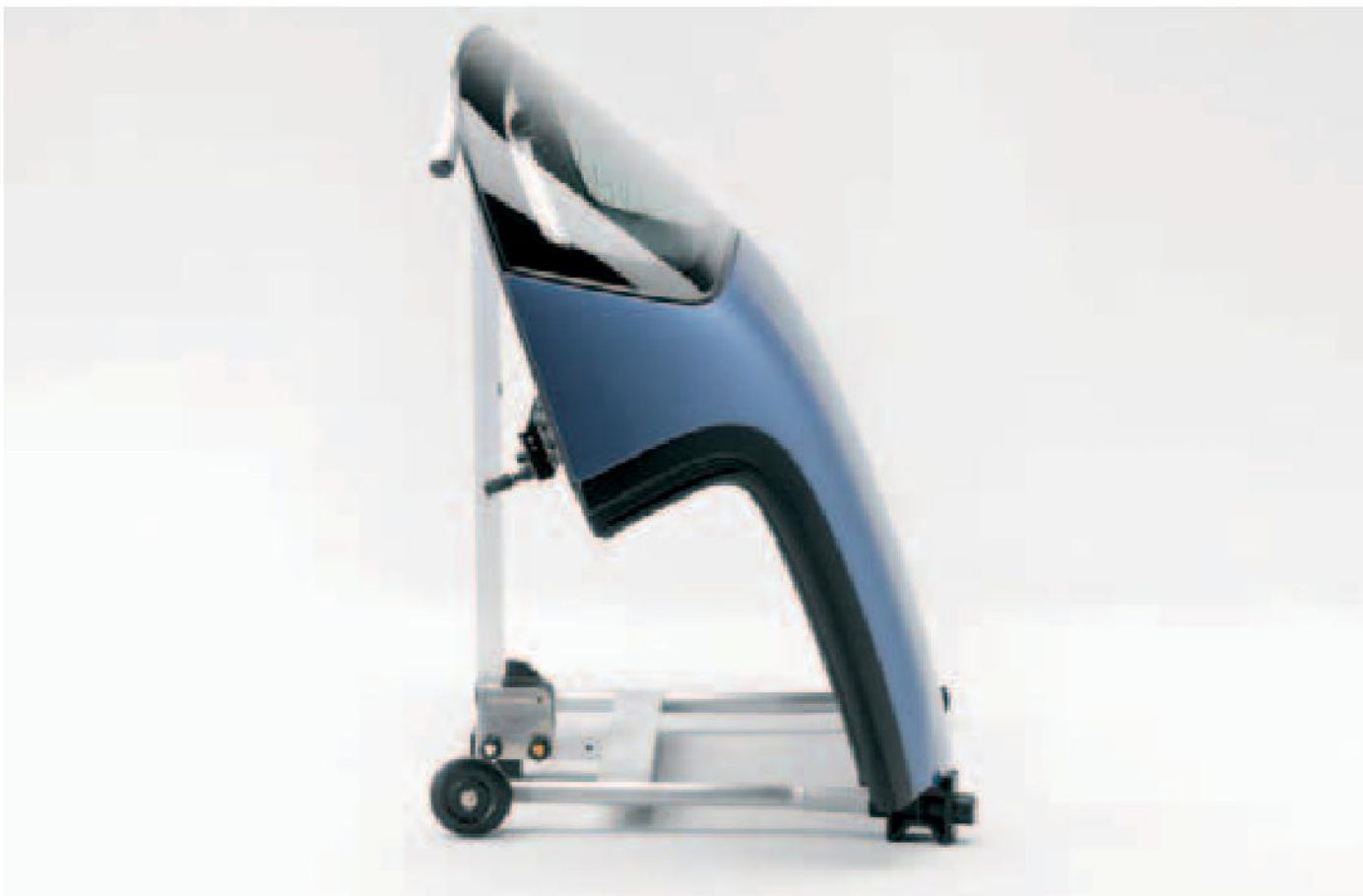
Con el soporte para la capota rígida, que viene de serie, podrá transportarla fácil y cómodamente.