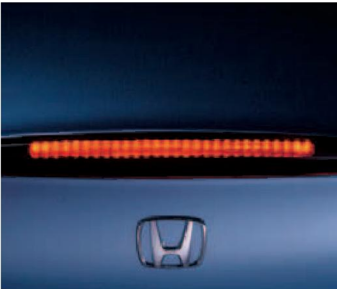
La gran intensidad y potencia de la luz de frenado trasera aporta mayor seguridad, a la vez que se integra a la perfección en el diseño del maletero del Honda S2000.