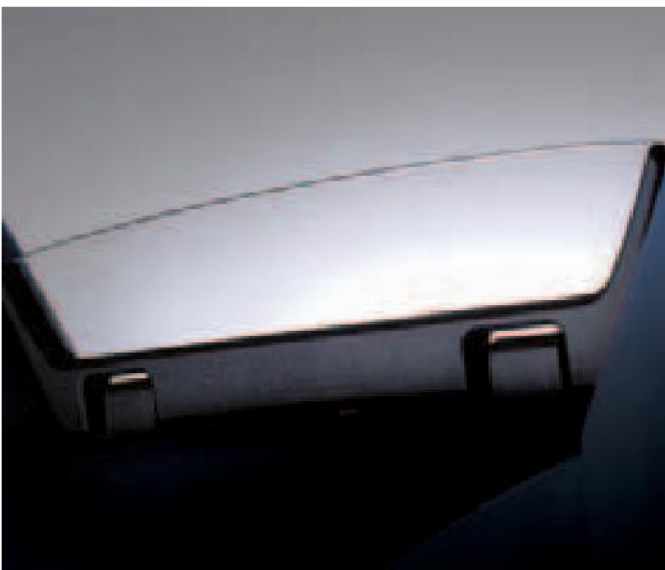
La turbulencia en el habitáculo se reduce gracias al deflector de aire plegable situado entre los reposacabezas.