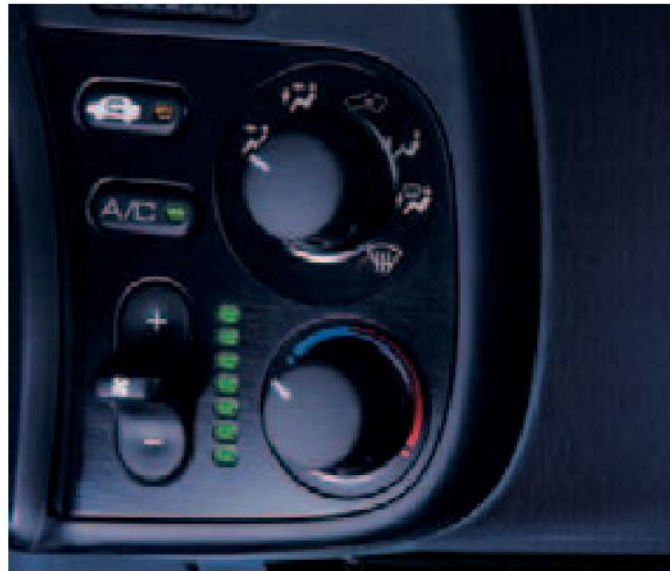
Para las ocasiones en que no resulta práctico conducir con el techo bajado, se puede controlar la temperatura interior accionando el aire acondicionado.