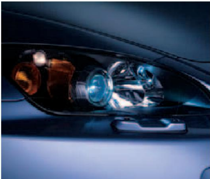
Faros de triple haz que proporcionan una iluminación potente en condiciones de poca luminosidad y están situados tras unas cubiertas aerodinámicas y resistentes al impacto.