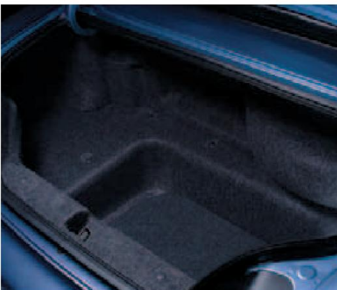
Aunque es un descapotable compacto, se dispone de un generoso espacio de maletero con una sorprendente capacidad para guardar equipaje.