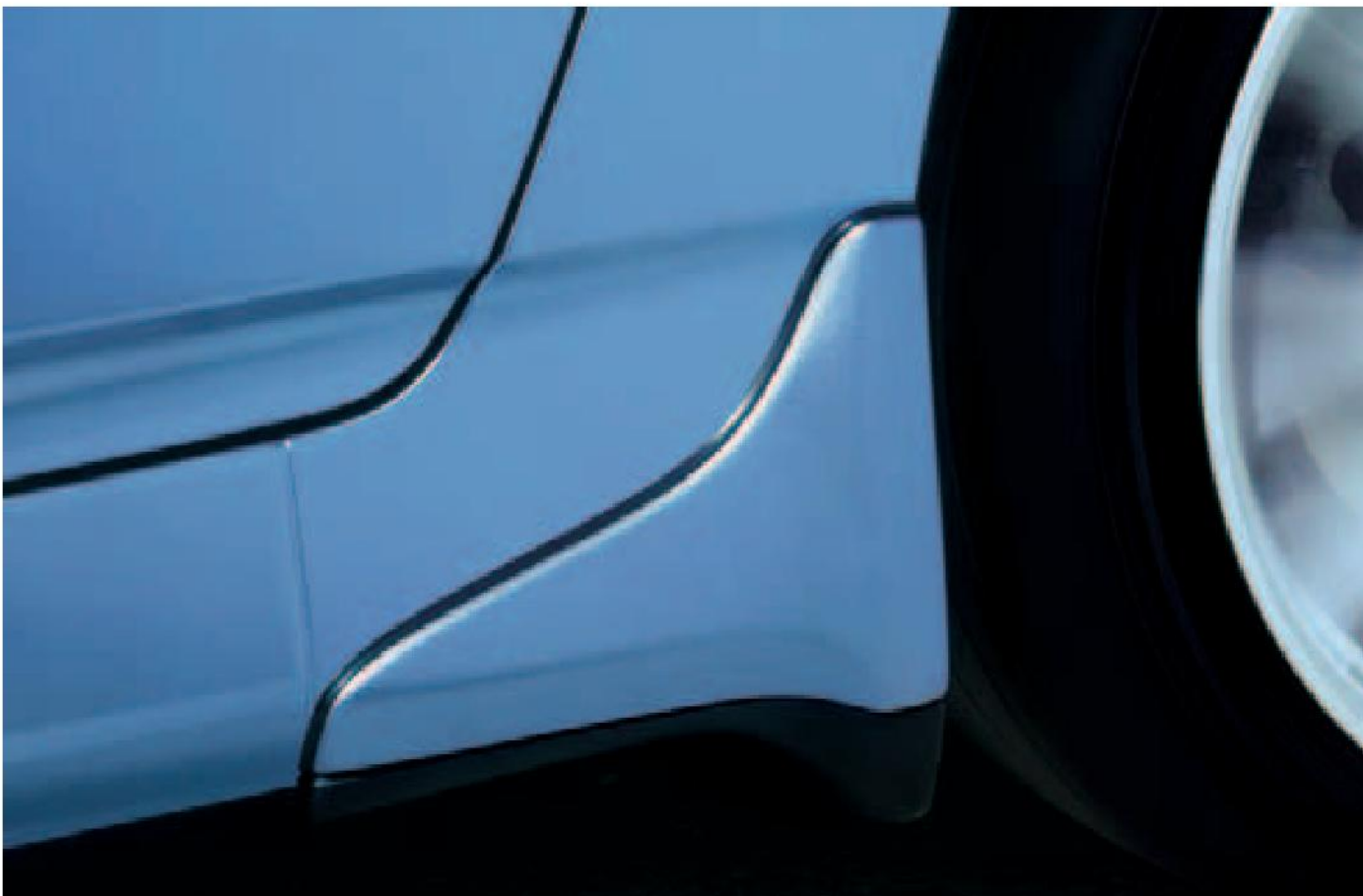
Con el fin de perfilar las sutiles líneas del Honda S2000, existen spoilers laterales. Estos suavizan todavía más la circulación del aire al pasar por los neumáticos traseros del vehículo.