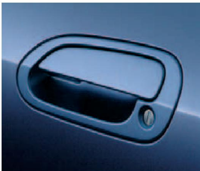
Las manecillas de las puertas del color de la carrocería están alineadas con la puerta, realzando la forma fluida del vehículo.