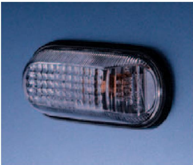
Los intermitentes están situados en una posición alta a los lados del Honda S2000 para disfrutar de una visibilidad máxima y son de color neutro para que armonicen con las suaves líneas del vehículo.