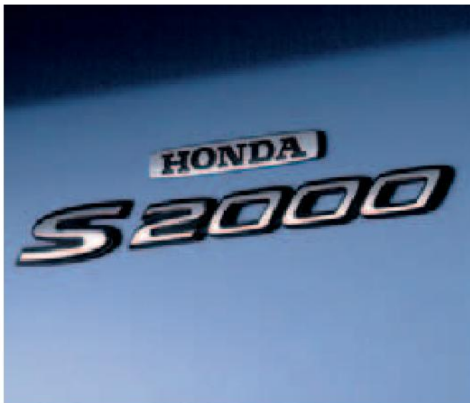
La placa de cromo completa el aspecto exterior de alta calidad del automóvil.