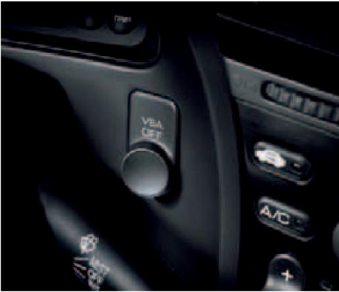
El control de estabilidad y tracción VSA ayuda a mantener el control al girar, acelerar y maniobrar para evitar colisiones.