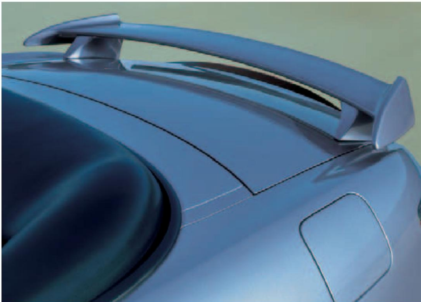
Un elegante alerón situado en el maletero realza aún más la imagen deportiva del Honda S2000.