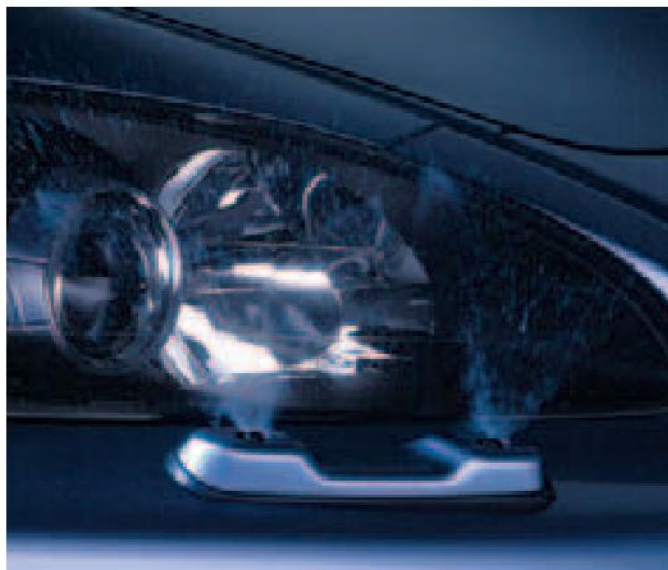
Para asegurarse de que los faros de xenón mantienen su rendimiento, llevan instalados de serie unos potentes lavafaros.