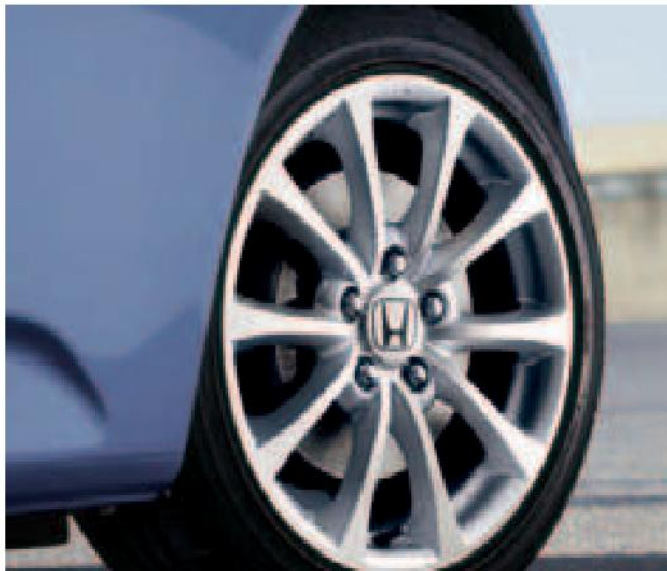
Las impresionantes llantas de aleación de 17 pulgadas realzan el aspecto más apasionante y deportivo del automóvil.