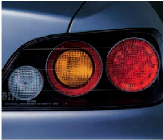
Luces traseras con LED de alta intensidad para mejorar la luminosidad.