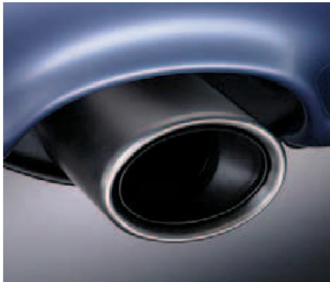
Un vistoso acabado en cromo confiere a los tubos de escape traseros un aspecto mucho más deportivo.