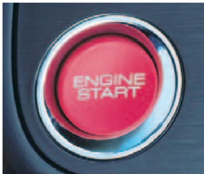
Botón de arranque del motor inspirado en los vehículos de competición.