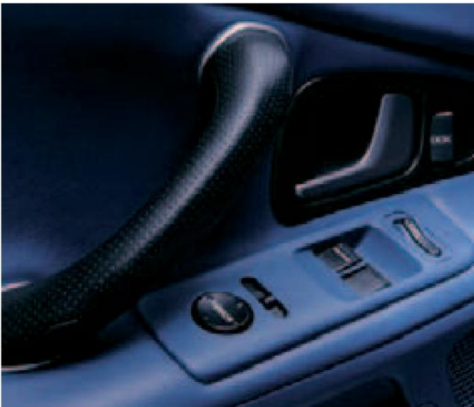
Los controles eléctricos de ventanillas y retrovisores a distancia están agrupados de forma práctica en el panel de la puerta del conductor.